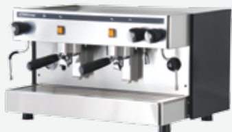
Two group semiautomatic