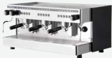
Three group electronic