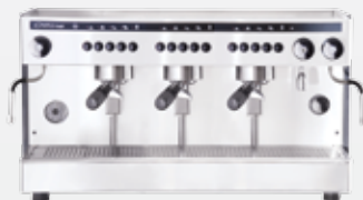
Three group electronic XL