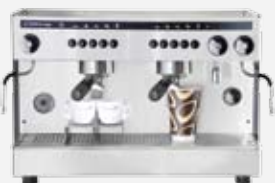
Two group electronic XL